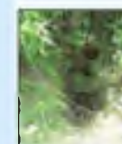
4 studánka Závěská NRPS 6817 N 50°6'41.69" E 14°20'55.08"

Ukázka jednoho z mnoha pramenů na patě jižního svahu okraje údolí. Stabilní pramen těsně pod cestou.