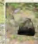
2 studánka Roztočilka NRPS 171 N 50°6'19.25" E 14°20'53.66"

Velmi pěkný a vydatný zdroj, leží poblíž stožáru el.vedení (110KV), nejlepší přístup je zdola podél oplocené zahrady. Voda je těsně u studánky zatrubněna a opět vyvěrá asi o 50 m níže pod trafostanicí ve strmé roklí, kde tvoří začátek krátkého bezejmenného potoka.